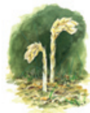
Tallörten saknar klorofyll. Den lever av att ta upp näring från döda växter.

På stranden växer saltarv, marviol och strandvial och på dynerna sandrör och strandråg. I tallskogen dominerar grå och gulvit renlav på marken. I de glesa tallskogarna trivs sandstarr, tallört, grönpyrola och i de slutna skogarna ljung och kråkbär. I söder ligger ett kärr med höga botaniska värden, där den hotade kransalgen mellanräfse, växer.