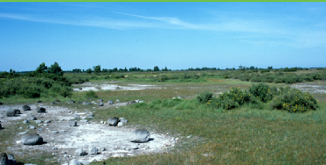
Uttorkad vät vid Möckelmossen.

Den som färdas längs den klassiska vägen mellan Resmo och Stenåsa möter ett storslaget alvarlandskap. Kanske blir Gyngge och Mysinge alvar den första kontakten med Stora Alvarets både karga och sällsamma skönhet.