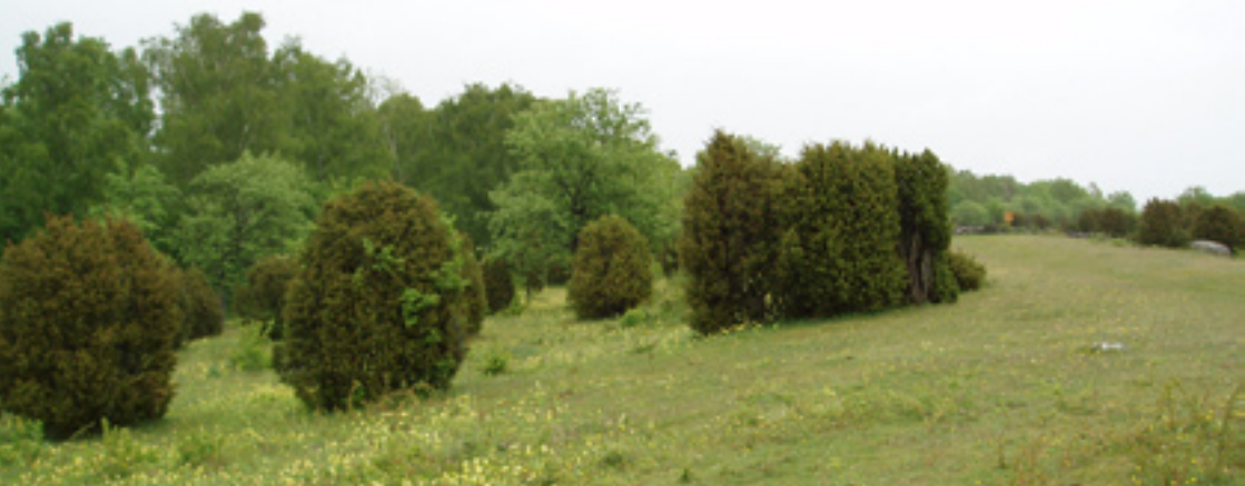
Blommande torräng på Jordtorpsåsen.

Få platser på Öland kan tävla med Jordtorpsåsen när det gäller strövvänlig och omväxlande natur, lämplig för en utflykt. Den mäktiga åsryggen har bildats genom svallning av forntida havsnivåer, då material avsatts i en strandvall.