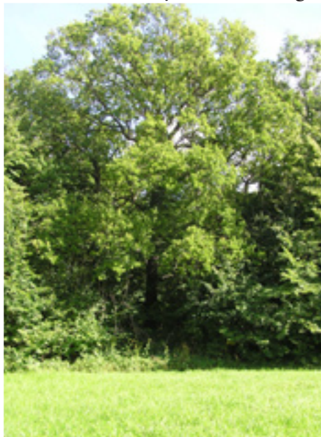
I lindreservatet är de ädla lövträden som ek, lind och ask vanliga.

Lindreservatet är ett av Ölands allra finaste naturreservat. Här finns ädellövskogar, tallskog, öppna betesmarker, alvar, kärr och örtrika slåtterängar. I reservatet kan du uppleva större bestånd av lind vilket är ytterst ovanligt idag.