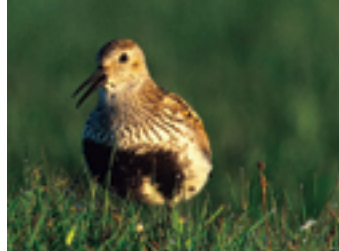
Sydlig ras av kärnsnäppa.