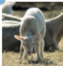
Gustav Vasa startade fåravel vid Ottenby.