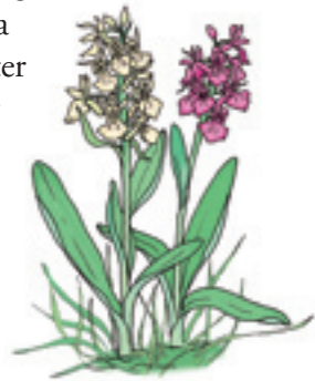
Adam och Eva.

I ängens västra del trivs orkidéer som Adam och Eva och göknycklar men även gullviva, fårsvingel, solvända, backtimjan, gulmåra och axveronika. Öster om strandvallen blir markerna fuktigare och här växer bl.a. majviva, brunört, krissla och blåtåtel.