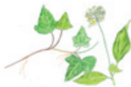
Murgrönan skapar en trolsk känsla.