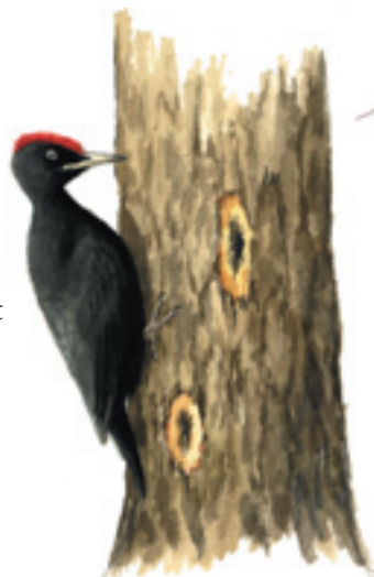
Spillkråkan hackar efter insektslarver i en gammal tall.

Kornas bete gör att Trollskogen har en öppen och luckig karaktär och här växer den sällsynta rylen, men även den lilla mandeldoftande linnean. Förekomsten av gamla ihålliga träd och mycket död ved gör att många insekter, trädsvampar och lavar trivs i Trollskogen t.ex. den sällsynta ädelkronlaven. Till de häckande fåglarna hör spillkråka och mindre korsnäbb. Här finns också Ölands säkraste lokal för talltita, en av öns ovanligaste häckfåglar.