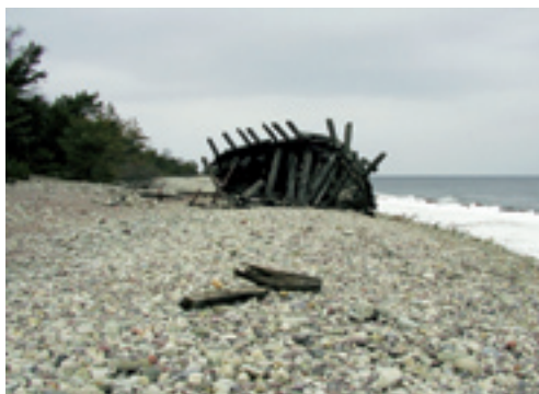
På den östra stranden ligger vraket efter den åländska skonaren ”Swiks” som förläste här vid en decemberstorm 1926.

På Ölands nordöstra udde har mäktiga strandvallar av klappersten under årtusendena formats av vind, vågor och inlandsis. I omgivande kustvatten leker strömming och skrubbskädda. Grankullaviken utgör en mycket viktig ”barnkammare” för många fiskarter.