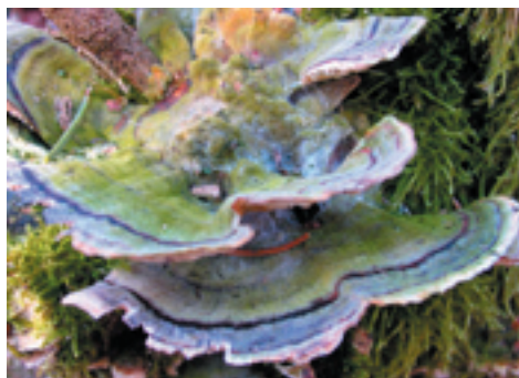
Tickor på ved i Vickleby ädellövsskog.

Lövskogen vid Vickleby har ett rikt fågelliv. Vid en inventering fann man att 41 fågelarter häckade i den skyddade delen av skogen. Till de vanligaste häckfågeln hör bofink, rödhake, lövsångare och grönsångare. Exempel på lite mer sällsynta arter är stenknäck, stjärtmes, mindre hackspett och skogsduva.