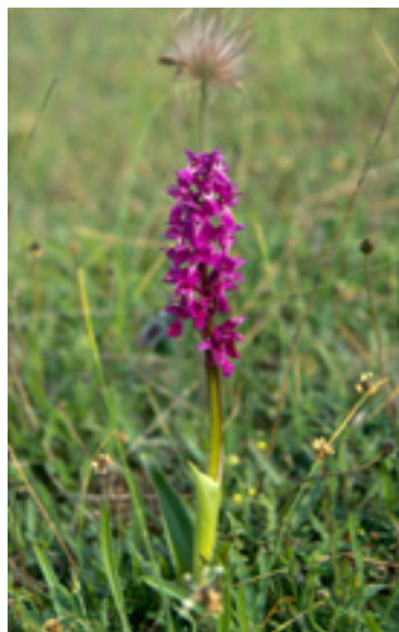
Sankt Pers nycklar.

Även djurlivet är representativt för Stora Alvaret. Karaktärsfåglar är sånglärka, ljungpipare, och stenskvätta. Ängshök söker föda i området. Av insekter kan nämnas rosenvingad gräshoppa och den säregna skalbaggen alvarlarvmördare, liksom fjärilarna bergskrabbemal, liten borstspinnare och ockragult nejlikfly.