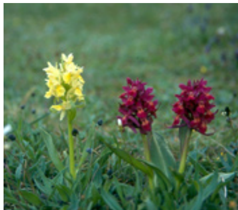
Adam och Eva.

På Vickleby alvar kan du uppleva Ölands orkidéprakt i maj. Några kilometer ut på Vickleby alvar finns den märkliga Resmazonen, en kraftigt vattenförande sprickzon som mynnar i Resmo källa, idag hela Mörbylångas vattentäkt.